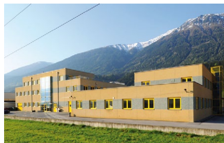
Der Firmensitz der SFS Fluidtechnische Systeme GmbH in Tirol.

SFS Fluidtechnische Systeme GmbH 6404 Polling, Gewerbezone 4 Tel.: +43/(5262) 64 62 60 Fax: +43/(5262) 64 62 64 info@sfs-fluidsysteme.com www.sfs-fluidsysteme.com