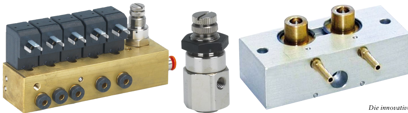
Die innovative Produktpalette der SFS.

■ Die SFS-Fluidtechnische Systeme GmbH mit Sitz in Polling (Tirol) ist der führende österreichische Anbieter von qualitativ hochwertigen Pneumatik-Sonderlösungen.